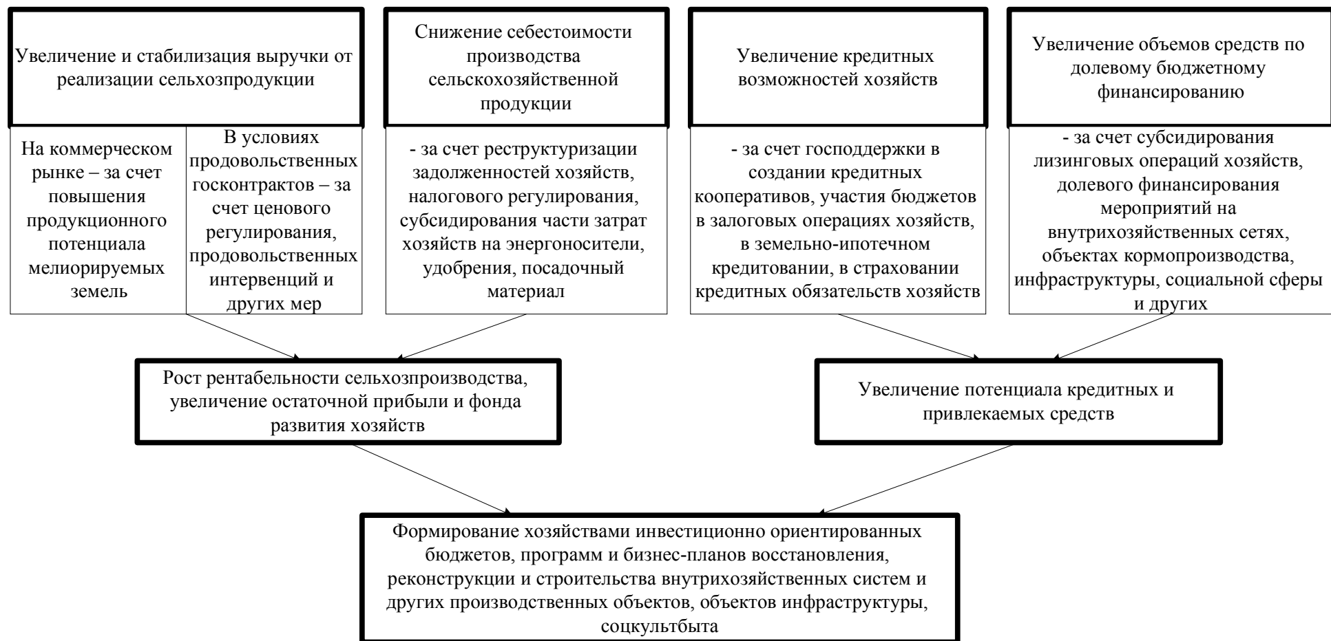
Рисунок 1 – Схема формирования инвестиционных бюджетов хозяйств в условиях реализации мер государственной поддержки мероприятий на внутрихозяйственных мелиоративных системах