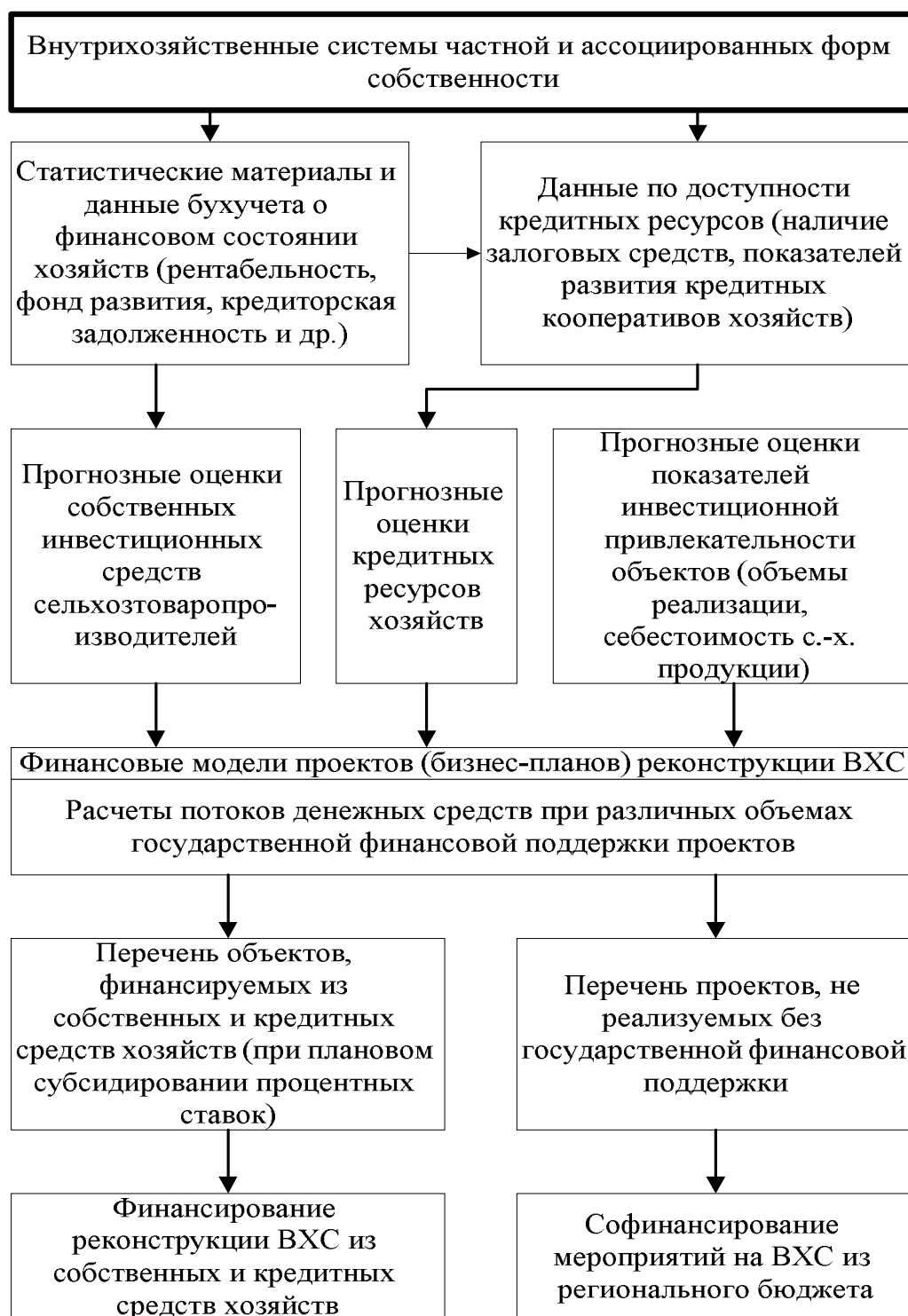
Рисунок 3 – Схема определения прогнозных оценок инвестиционных средств хозяйств

- кредитные ресурсы хозяйств оцениваются с привлечением следующих данных: о возможности хозяйств-заемщиков выполнять залоговые требования коммерческих банков, о включении заемщиков в утвержденные списки претендентов на субсидируемые кредиты, о наличии хозяйств-заемщиков в составе кредитных потребительских кооперативов.